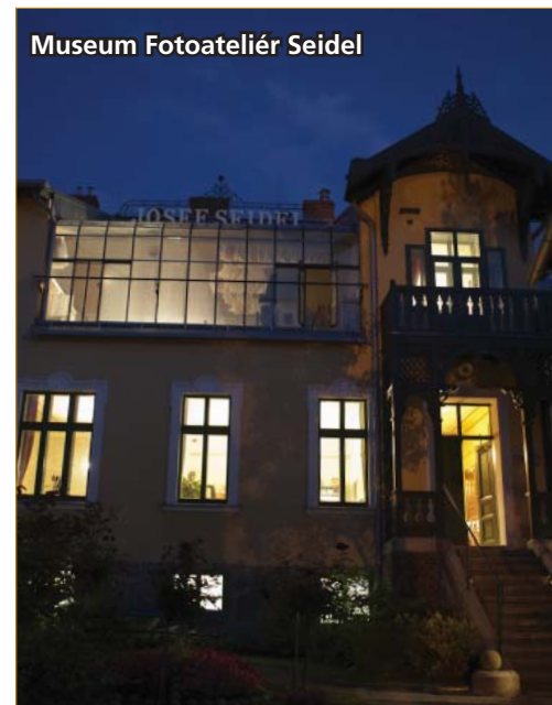
Museum Fotoateliér Seidel

Turista. Tento webový portál spolu s řadou dalších projektů směřujících k rozvoji kulturního a turistického potenciálu města Český Krumlov finančně podpořil Regionální operační program Jihozápad.