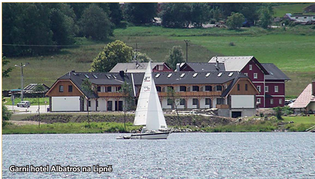
Garni hotel Albatros na Lipně

vašich aktivit na Lipně. Tento webový portál kromě základních informací o regionu mapuje nejbližší akce všeho druhu pořádané na Lipensku. Pokud se chystáte na delší dovolenou u Lipna, můžete si prostřednictvím této stránky zakoupit tak zvanou Lipnocard. S kartou získáte slevy na nejrůznější služby v regionu – od půjčení sportovního vybavení přes gastronomické služby až po vstupy na zámky a do muzeí či hlídání dětí. Pro své návštěvníky nabízí Lipno širokou paletu možností – stačí si pouze vybrat, co baví právě vás. Celý region je protkán cyklistickými trasami různých náročností, takže