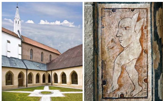
Nádvoří kostela a jedna z rekonstruovaných fresek

Cílem projektu bylo dokončení dlouhodobé rekonstrukce kostela sv. Jana Křtitele a kláštera minoritů v Jindřichově Hradci. Projekt se skládal ze dvou aktivit - rekonstrukce posledních neopravených prostor - 2 dvorů a zrestaurování gotických nástěnných maleb v kostele sv. Jana Křtitele, které jsou součástí nemovité kulturní památky. „Projekt znamenal mimo jiné zkulturnění hlavního vstupního prostoru do kostela a minoritského kláštera a rovněž revize gotických maleb v interiéru. Zrekonstruované dvory celkově pozvedly úroveň veřejných prostranství v místě a budou muzeu už trvale sloužit. K projektu jsme zaznamenali výhradně kladné reakce z okolí. Obnova gotických maleb v kostele zcela jednoznačně prodloužila jejich život a zatraktivnila je pro návštěvníky a veřejnost,“ uvádí projektový manažer pan Pikal.