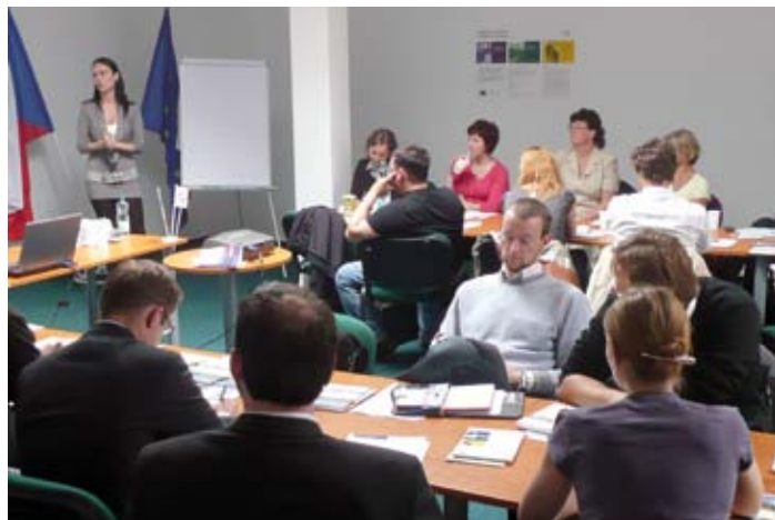
Seminář pro příjemce v Českých Budějovicích

Ve druhém květnovém týdnu připravil Úřad Regionální rady na obou územních odborech v Českých Budějovicích a v Plzni semináře pro příjemce podpory z 11. výzvy ROP Jihozápad zaměřené především na realizační fázi projektového cyklu, nejčastější pochybení při realizaci, jejich předcházení a řešení. Semináře pro příjemce se konají pravidelně vždy po schválení financování projektových žádostí Výborem Regionální rady.