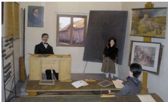
Ukázka expozice z Muzea severního Plzeňska

Vznik areálu v Mariánské Týnici se datuje do první poloviny 18. století. Stavební práce byly ukončeny 1751, kostel byl vyzdoben a posléze vysvěcen k roku 1762. Areál probošství, kde nyní sídlí Muzeum a galerie severního Plzeňska, byl prohlášen za kulturní památku již před rokem 1988. V roce 1920 se zřítíla jeho kupole, která byla obnovena až v roce 2000.