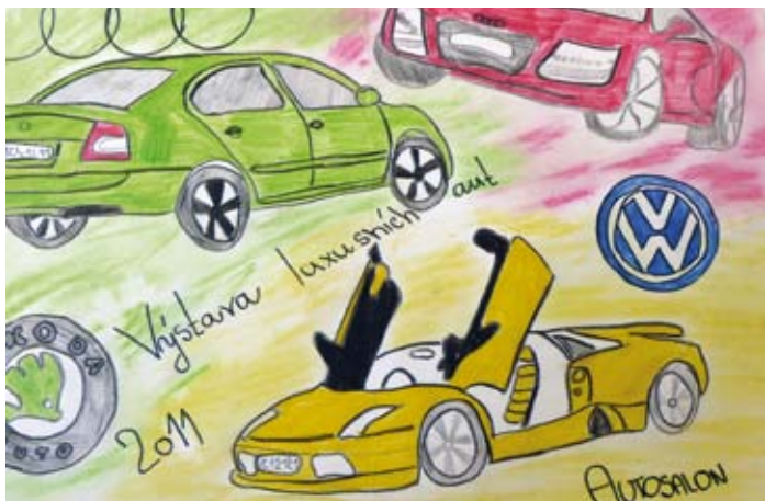
Výstavu luxusních aut by za dotaci uspořádala jedna ze studentek vítězné školy