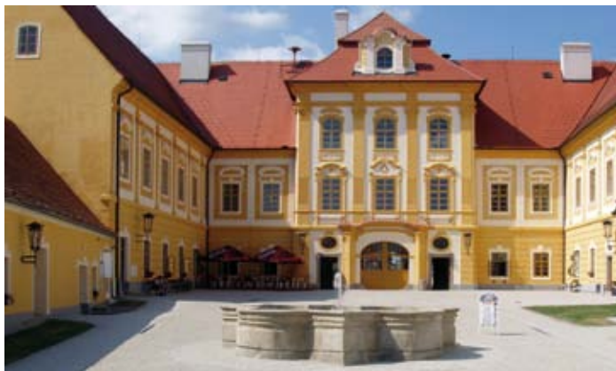
Nádvoří zámku v Borovanech

Předmětem tohoto projektu byla s ohledem na náročnost prací pouze vlastní rekonstrukce památky. Zřízení expozice a vybavení informačního centra je řešeno v navazujícím projektu. Turistické centrum poskytuje informace o městu a jeho okolí a zároveň zajišťuje obsluhu expozice. V rámci projektu byly rekonstruovány tyto prostory: společenský a kulturní sál, oblužné prostory a část zámeckého dvora. Součástí projektu je dále vybavení městské knihovny, která je umístěna v již rekonstruovaném západním křídle.