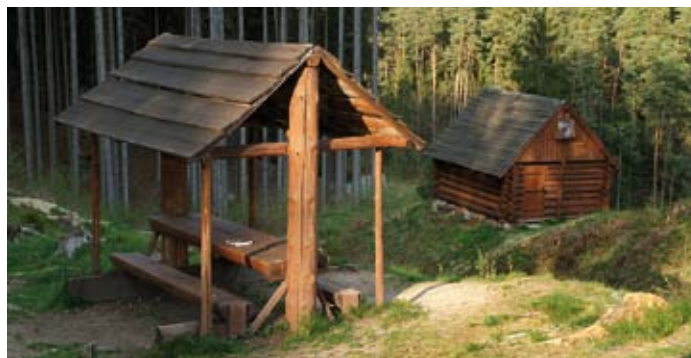
Nový mobiliář v blízkosti hradu