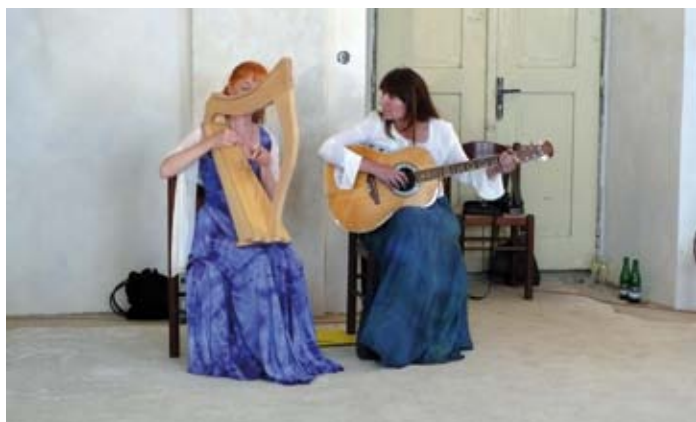
Koncert dobové hudby v prostorách zámku

Realizace společenského, kulturního a ubytovacího centra v zámeckém areálu v Hrádku u Sušice vrátila život do opuštěné významné historické památky. Zároveň ji zpřístupňuje veřejnosti a vytváří ucelený program nabídky služeb a kulturních akcí pro celý region. Logicky zapadá do celkové sítě cestovního ruchu svou ubytovací kapacitou a nabídkou vytvoření kulturní části včetně muzea Františka Pravdy. Charakteristickým pojítkem celého projektu je záchrana historicky významného a cenného objektu. Uživatelská náplň společenského, kulturního a ubytovacího centra zásadním způsobem zvýší potenciál a atraktivitu objektu pro cestovní ruch, výrazně přispěje k úpravě veřejných prostranství (park), zlepší vzhled památkově chráněných území, zvýší úroveň a stabilitu venkovského sídla Hrádek. Přispěje ke zvýšení zaměstnanosti v regionu.