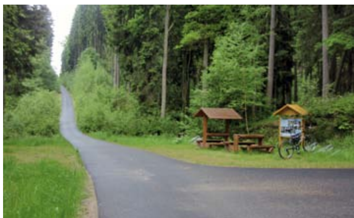
Unavení cyklisté mohou na trase využít odpočívadel

kteřá byla dosud skryta pod hladinou přehrady. Násypem na ni byla vybudována část nové cyklostezky. Cyklostezka je vedena atraktivním, historicky i přírodovědně hodnotným územím, jež je začleněno mezi evropsky významné lokality Natura 2000. Podél cyklostezky si lidé mohou přečíst zajímavosti o fauně a floře na 20 tabulích, k dispozici mají odpočívadla s posezením. Přes Zlatěšovický potok pod Babou se dostanou po novém mostku. Na druhém konci obce Purkarec mohou turisté navštívit pamětní síň vorašství a plavectví. Ves spolu s nedalekým Karlovým hrádkem počátkem 14. století založil Karel IV.