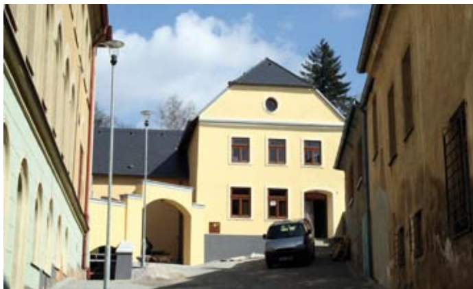
Pohled na rekonstruovaný dům Augustina Němejce

malý sál v nově zrekonstruované stodole, tak malířský ateliér v podkroví domu, a rovněž vkusně a účelově zrekonstruovaný venkovní prostor nádvoří bývalé školy s letní scénou.