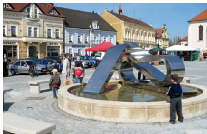
Oceněná stavba – zrekonstruované náměstí T. G. M. v Dobřanech