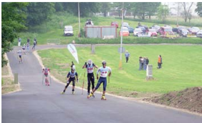
Dráha s asfaltovým povrchem pro multifunkční využití

či skateboardistům) a v zimním období běžkařům. Areál bude moci využívat prakticky kdokoli - rodiny s dětmi, školy, dospělí, senioři i zdravotně postižení díky bezbariérovosti areálu.