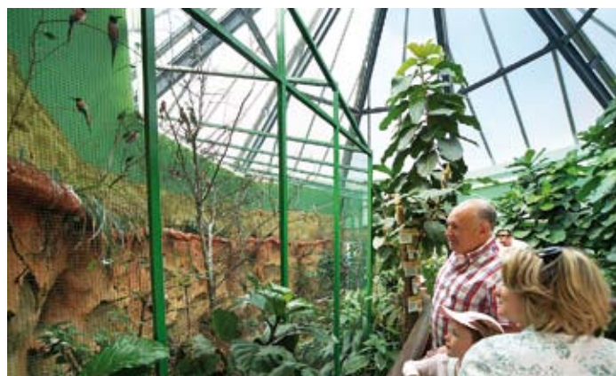
Pavilon s exotickým ptactvem

Cílem projektu je zvýšit atraktivitu ZOO Plzeň jako vyhledávaného cíle turistického ruchu nejen v Plzni, ale také v rámci Plzeňského kraje. ZOO Plzeň si klade za cíl přilákat nejen nové