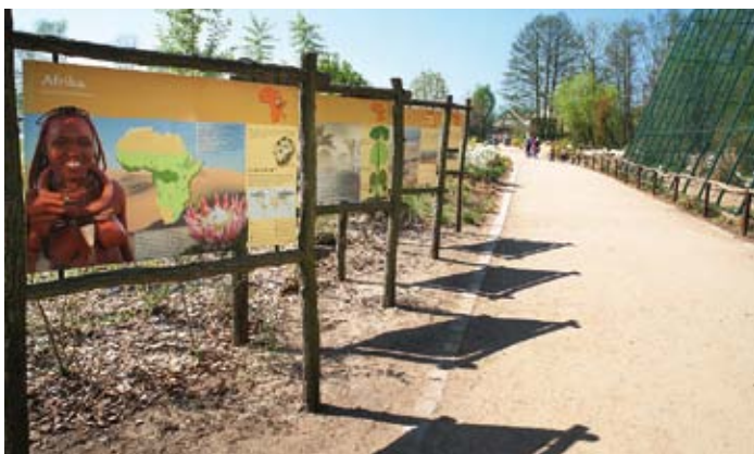
Informační tabule k novým pavilonům

návštěvníky, ale přimět k opakovaným návštěvám i ty, kteří již zahradu navštívili dříve.