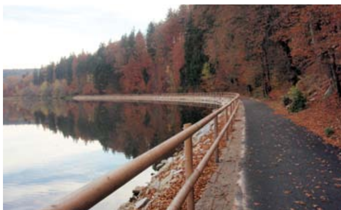
Malebná krajina v okolí cyklostezky