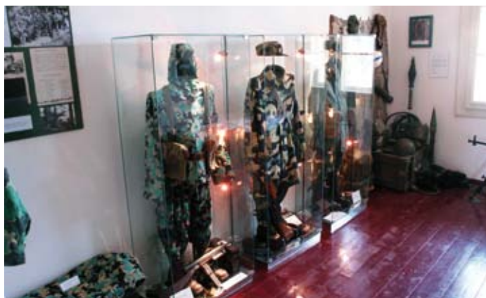
Výstava s vojenskou tematikou

Kořeny tohoto projektu sahají až do roku 2005, kdy byla poprvé formulována myšlenka, aby obec využila získaný kasárenský areál nejen k výrobním a komerčním činnostem, ale i k vytvoření kulturního centra. Díky projektu byly rekonstruovány dvě historické budovy objektů nacházejících se na okraji bývalého vojenského areálu ve Strašicích. Někdejší vila s byty důstojníků se změnila na první část expozice. Sklepní expozice evokuje podmínky protiletectvého krytu. Vystaveny jsou předměty připomínající civilní obranu a hasičské záchranné sbory. Dále je zde přírodovědná a paleontologická expozice, která představuje vývoj života od svrchního proterozoika po kvartér, přičemž se soustředí především na oblast Středních Brd a jejich okolí. Zoologická část představuje řadu zdařilých dermoplastických preparátů. Za zmínku stojí i expozice hornictví a minera-