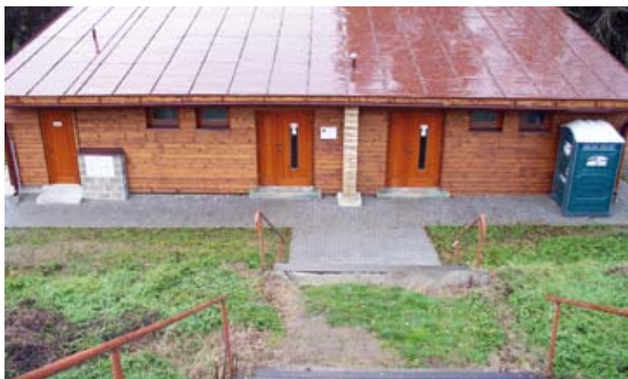
Nové sociální zařízení ve sportovně-rekreačním areálu

dřezy. Rekonstrukce a rozšíření asfaltové dráhy spadá do etapy druhé. Vybudovaná dráha slouží od poloviny roku 2010 hlavně in-line bruslařům, případně dalším sportovcům (např. cyklistům