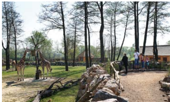
Africká savana a její obyvatelé