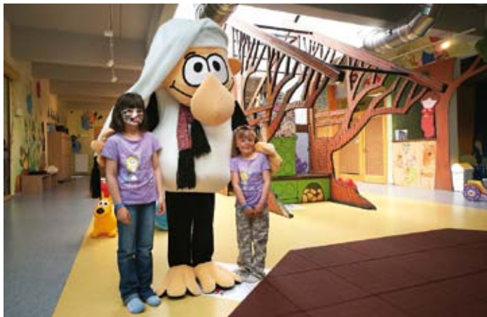
Setkání s Vochomůrkou

Nápad vytvořit v Plzni Dům pohádek vznikl v roce 2006 během pořádání výstavy k padesátinám známé kreslené postavičky Krtečka, která se setkala s obrovským úspěchem. Také díky dotaci z ROP Jihozápad ve výši 25 milionů tak v Plzni na zelené louce vyrostl pohádkový dům, do kterého se mohou za postavičkami z večerníčků vypravit děti z celé republiky. Projekt je zcela ojedinělý.