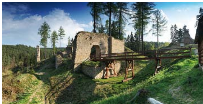
Zřícenina hradu Pořešín a její krásné okolí

panelech přečíst kapitoly z historie hradu, články o středověkém životě, právu útrpném, způsobu oblékání, středověkém hornictví a vychutnat si nezkomolenou podobu středověkého hradu bez jakýchkoli přidaných komerčních aktivit tak, jak je to často u našich památek k vidění. V letním období jsou organizovány akce pro širokou veřejnost, divadelní představení nebo koncerty. Tyto akce probíhají tradičně ve večerních hodinách, kdy je hrad osvětlen loučemi a svíčkami.