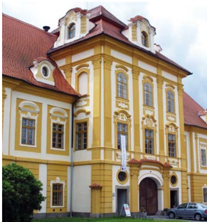
Průčelí zámku v Borovanech