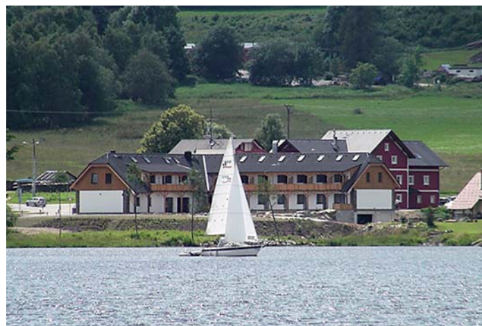
Pohled na hotel ALBATROS.