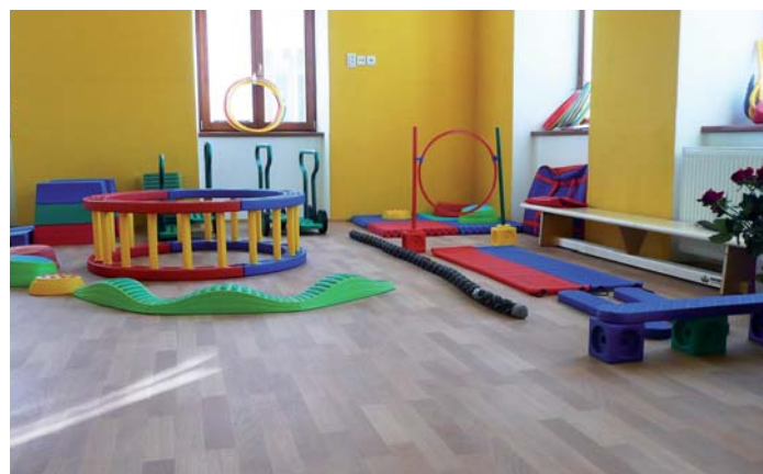
Děti v Nových Hradech si mohou užívat nové vybavení školky.

Celkové výdaje projektu: 5 559 873 Kč Výše podpory z ROP JZ: 5 142 882 Kč