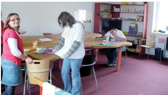
Nově upravené prostory dílen stacionáře Pohodička.

Realizací projektu došlo k rekonstrukci objektu a vybavení budovy (stacionář, kuchyňka, šatna, počítačová učebna, tkalcovna, keramická dílna, kanceláře a pracovny specializovaných odborníků, hygienické místnosti). Ve vzniklé sociálně terapeutické dílně a stacionáři tak bude moci 10 klientů s těžkým stupněm postižení zkombinovat práci v dílnách s rehabilitací a odpočinkem ve stacionáři. Dalším 10 lidem se středním stupněm postižení a prokázanou schopností vyššího