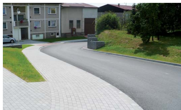
Zrekonstruované komunikace v Kladrubech.