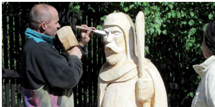
Den řemesel v Chanovicích.

Celkové výdaje projektu: 640 575 Kč Výše podpory z ROP JZ: 592 530,99 Kč