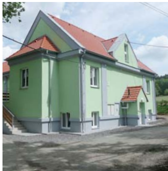
Stav sokolovny v Kažehu před a po rekonstrukci.