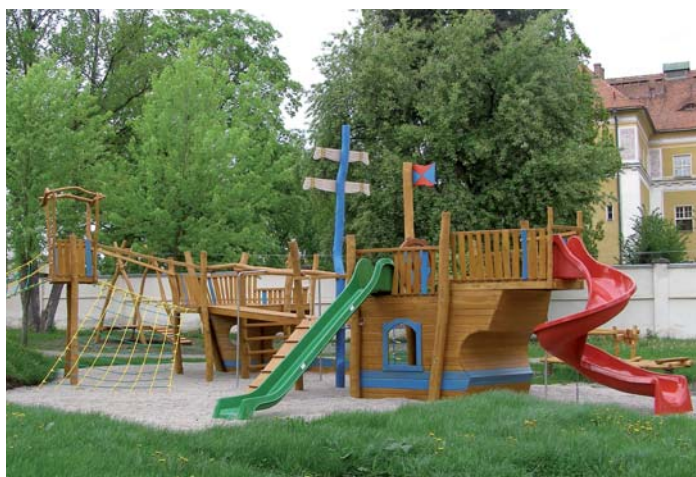
Nová dětská atrakce – pirátská loď Černá Perla Sušice.