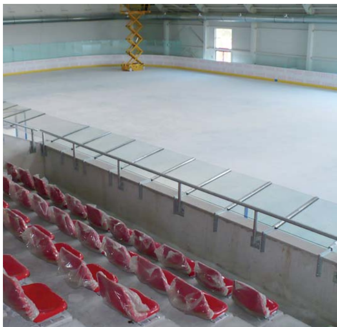
Nová ledová plocha v Plzni splňuje parametry pro sportovní klání na nejvyšší úrovni.

Výše podpory z ROP JZ: 100 860 884,00 Kč