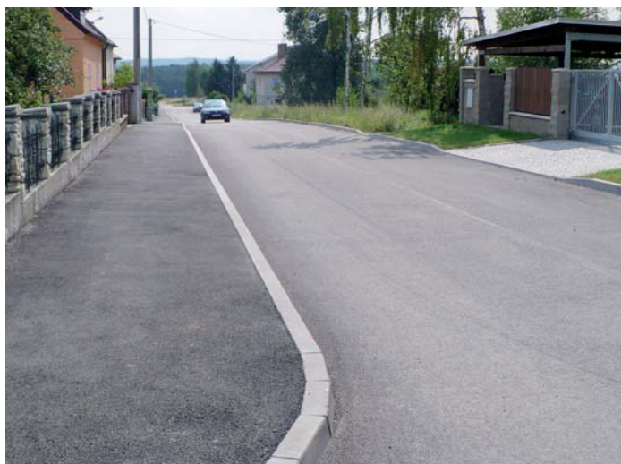
Nová komunikace v obci Zruč – Senec.

Záměrem projektu „Komplexní rekonstrukce místních komunikací v obci Zruč – Senec – II. etapa“ byla rozsáhlá rekonstrukce místních komunikací v centru obce nacházející se na Plzeňsku. Jedná se o 5 komunikačních větví, které jsou důležitým prvkem při napojení obytné zóny na silnici II. třídy.