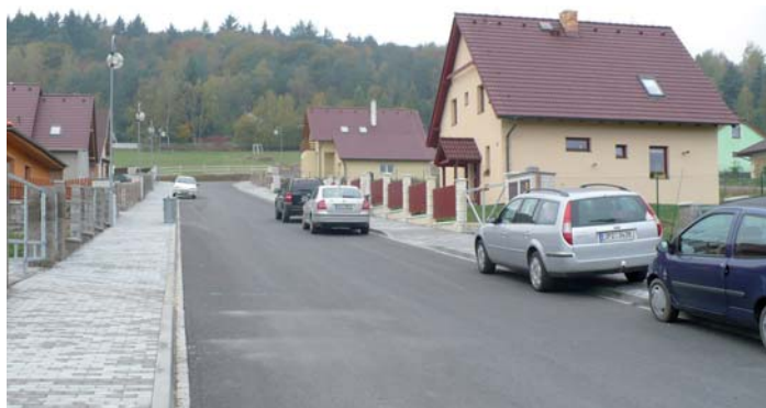
Pohled na novou místní komunikaci ve Zbirohu.

Výzva č. 2, oblast podpory: 1.5 Rozvoj místních komunikací Celkové výdaje projektu: 11 528 239,50 Kč Výše podpory z ROP JZ: 10 145 991,81 Kč