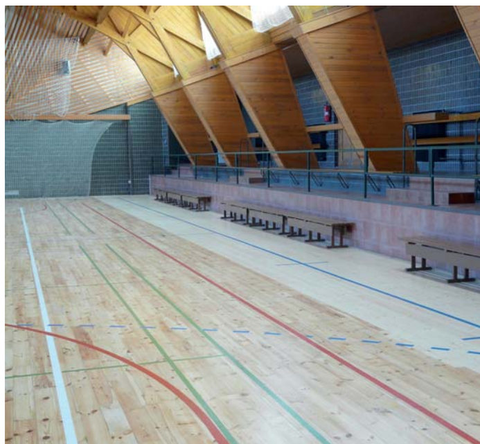
Nový povrch ve sportovní hale ve Vodňanech.