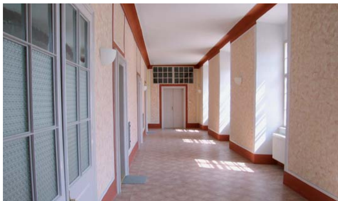
Opravený interiér regionálního muzea Čestice.

Hlavním cílem rekonstrukce schodiště k Regionálnímu muzeu v Česticích bylo odstranění škod způsobených jak vlivem času, tak i podmínkami prostředí, ve kterém se schodiště nalézá. K poškození schodiště došlo v neposlední řadě i následkem nevhodných stavebních úprav z šedesátých a sedmdesátých let minulého století. Zásadním přínosem mělo být oživení historického a kulturního dědictví Čestic – barokního zámku a pro nárůst potenciálu cestovního ruchu na území mikroregionu s názvem Svazek obcí šumavského Podlesí.