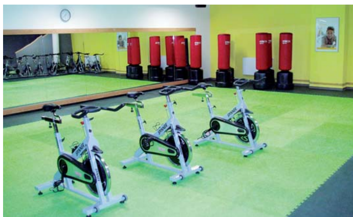
V novém centru v Harmony Clubu v Písku naleznete prostory pro sport i relaxaci.

Celkové výdaje projektu: 18 344 657,42 Kč Výše podpory z ROP JZ: 8 624 294,92 Kč