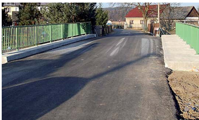
Most v Mirošově po rekonstrukci.

Výzva č. 2, oblast podpory: 1.5 Rozvoj místních komunikací Celkové výdaje projektu: 2 267 033 Kč Výše podpory z ROP JZ: 2 097 005,50 Kč