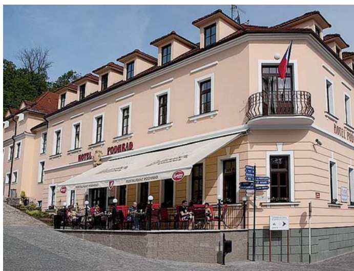
Pohled na novou fasádu hotelu Podhrad v Hluboké nad Vltavou.

Smyslem projektu bylo dokončení revitalizace hotelu Podhrad v Hluboké nad Vltavou, který byl sice v 90. letech minulého století částečně zrekonstruován, nicméně stavební práce nebyly z důvodu finančních potíží minulého vlastníka dokončeny. Hotel byl tak i přes svou původní slávu téměř 15 let uzavřen. Stavební úpravy dosud nevyužívaných prostor objektu umožnily rozšíření služeb hotelu a tím tolik potřebné doplnění kvalitní infrastruktury v oblasti cestovního ruchu. Realizace projektu vedla především k přílivu nových návštěvníků, a to jak do samotného ubytovacího zařízení, tak do celého regionu. Projekt byl zaměřen nejen na rozvoj hotelových služeb, ale především na rozvoj města Hluboká nad Vltavou a na snížení nezaměstnanosti v regionu.