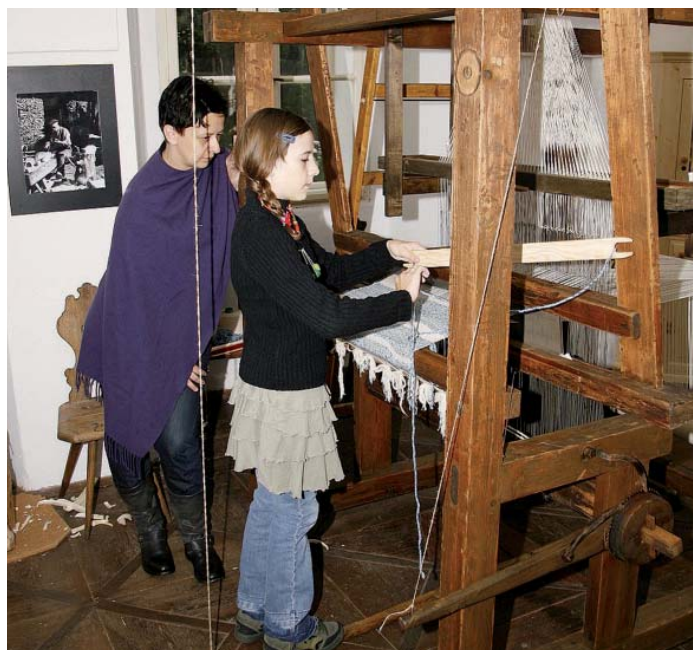
Tkalcovský stav poutal pozornost při slavnostním otevření dílny.