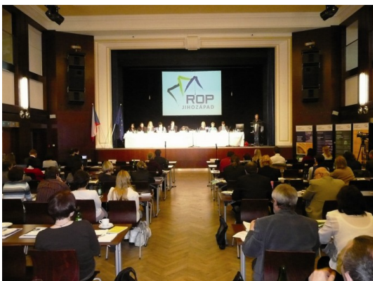
Na Výroční konferenci ROP Jihozápad za rok 2008, která se konala 17. 12. 2008 v Kulturním domě Písek, se sešla téměř stovka účastníků.