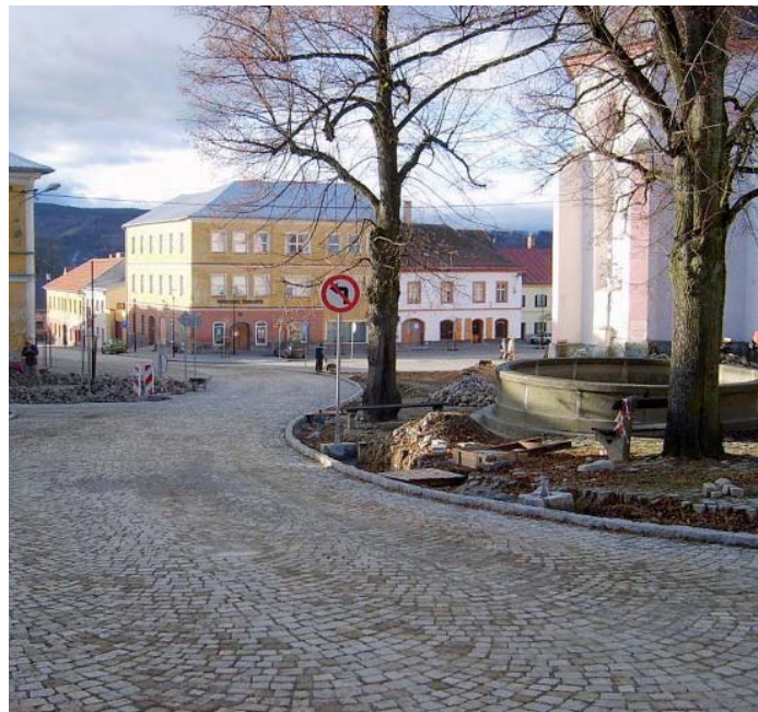
Probíhající rekonstrukce náměstí v Kašperských Horách.

Cílem projektu „Revitalizace náměstí Kašperské Hory“ byla rekonstrukce hlavního náměstí, které tvoří historické jádro města. V rámci největší investice města za posledních 20 let byly provedeny rozsáhlé úpravy povrchu náměstí a vyřešena celková dopravní situace na náměstí. Archeologický průzkum v rámci stavebních prací přinesl překvapující nález - objevení pokladu v podobě stříbrných mincí z přelomu 16. a 17. století! Město Kašperské Hory tak získalo hned dvě nová lákadla pro návštěvníky – opravené městské centrum a vzácný mincovní poklad. Projekt byl v rámci 2. výzvy ROP Jihozápad podpořen částkou téměř 12 milionů korun.