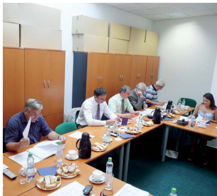
Výbor Regionální rady rozhodl o přehodnocení 5. a 6. výzvy ROP Jihozápad.

Přehodnocování projektů z 5. a 6. výzvy však běží podle původního plánu. Všechny projekty z 5. a 6. výzvy byly již přehodnoceny a čekají na schválení Výborem Regionální rady.