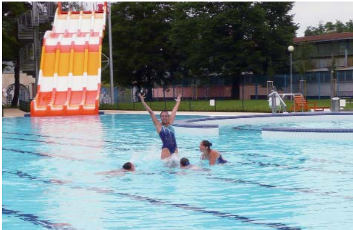
Zrekonstruovaná letní plovárna v Českých Budějovicích.

Dne 21. 7. 2010 byla slavnostně otevřena letní plovárna na Sokolském ostrově v Českých Budějovicích, jejíž rekonstrukce byla finančně podpořena z ROP Jihozápad. Slavnostního zahájení provozu plovárny se zúčastnili hlavní představitelé města, realizátoři stavby a média. Oproti dřívějšímu se zde dnes nalézá velký moderní tobogán, opravený bazén s umělými vlnami, brouzdaliště s vodotryskem, zařízení umožňující přístup do bazénu hendikepovaným a uzamykatelné skříňky na cennosti.