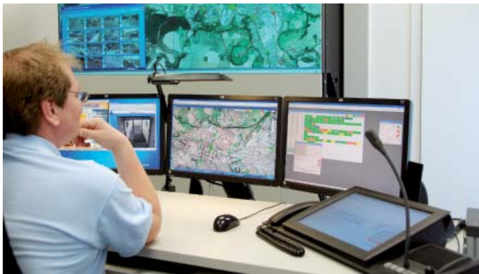
Nový dynamický dispečink pro řízení veřejné dopravy v Plzni.

V Plzeňském kraji již byly proplaceny všechny projekty schválené v oblasti podpory 1.2 Rozvoj infrastruktury pro veřejnou dopravu. Konkrétně se jedná o výstavbu parkovacích ploch