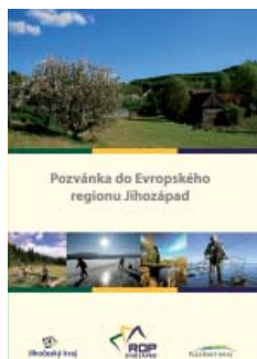
Titulní strana průvodce po euroregionu

Regionální rada regionu soudržnosti Jihozápad vydala ve spolupráci s Krajskými úřady Jihočeského a Plzeňského kraje průvodce po „euroregionu Jihozápad“. Publikace Pozvánka do Evropského regionu Jihozápad obsahuje tipy na zajímavé výlety v Jihočeském a Plzeňském kraji s cílem představit opravené památky, nové komunikace, rekonstruované hotely či penziony a další projekty podpořené z finančních prostředků ROP Jihozápad. Publikace jsou veřejnosti k dispozici na krajských úřadech, eurocentrech, infocentrech krajských měst, hospodářských komorách či v sídlech Regionální rady regionu soudržnosti Jihozápad v Českých Budějovicích a v Plzni.