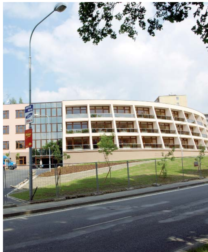
Nově otevřený Městský domov pro seniory Domažlice.